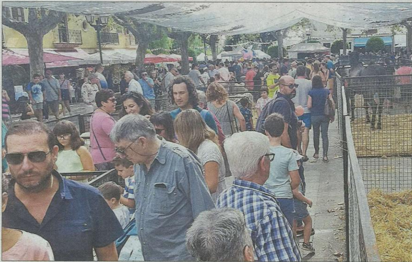
Las calles céntricas de Artà se llenaron de tradición y muchos visitantes en un día entre nubes y sol. BIEL CAPÓ