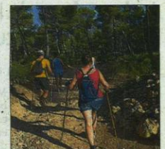
Senderismo en Son Jaumell.

► Para dar a conocer el sendero GR East Mallorca se hará una exhaustiva labor de promoción. Se realizarán videos que muestren los recursos más turísticos y una web con la información del sendero que el usuario pueda consultar antes de visitar la isla. Se presentará en la ITB de Berlín, la WTM de Londres y en Fitur.