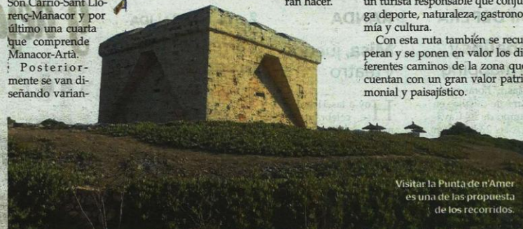
Visitar la Punta de n'Amer es una de las propuestas de los recorridos.

tes y desviaciones para que los usuarios puedan elegir en función de los kilómetros que quieren hacer.