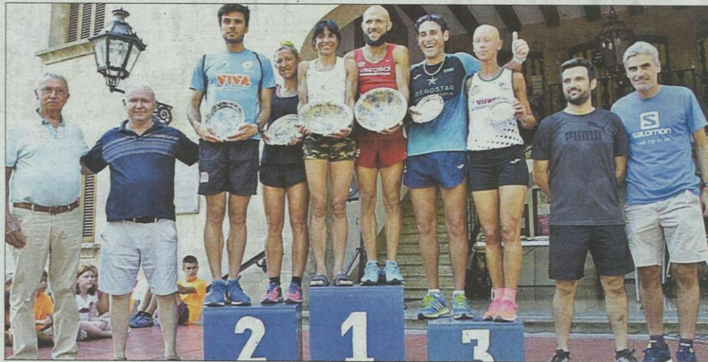
Los primeros clasificados posan en el podio tras recibir sus respectivos trofeos.