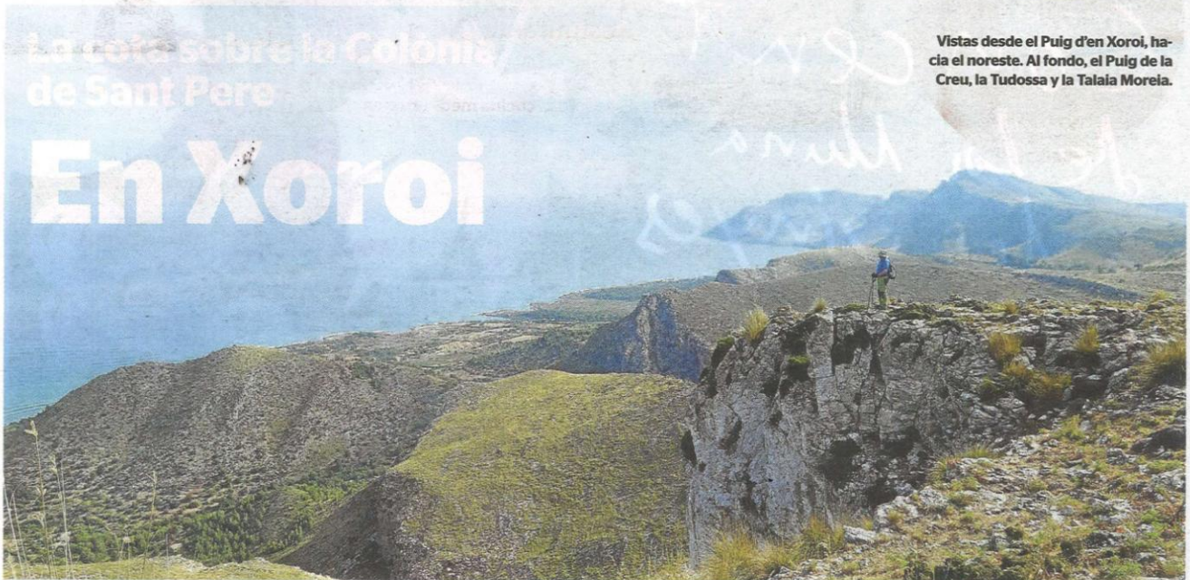
Vistas desde el Puig d'en Xoroi, hacia el noreste. Al fondo, el Puig de la Creu, la Tudossa y la Talaia Moreia.

La cota sobre la Colonia de Sant Pere En Xoroi