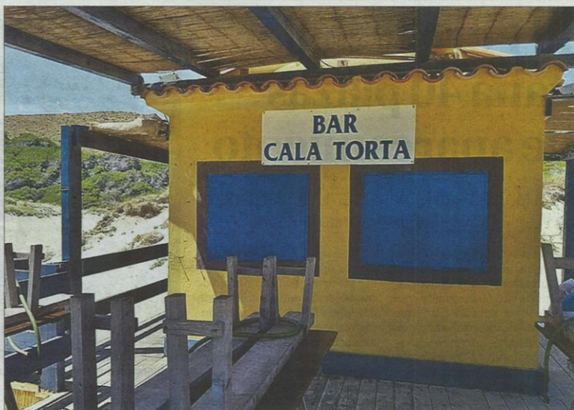
El chiringuito de Cala Torta, recordado por bañistas y vecinos estos días por redes sociales.

El pasado 11 de junio Demarcación de Costas ordenó el cierre de las instalaciones del chiringuito de Cala Torta, al tiempo que levantó