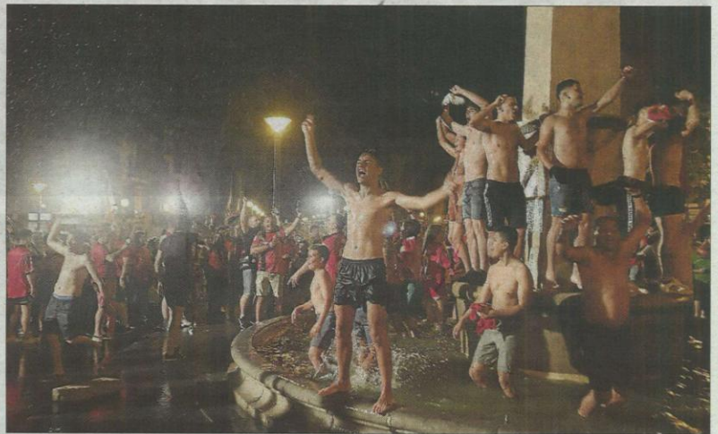
Torgulas rojas. La popular fuente de las Tortugas se tiñó de rojo para recibir a los aficionados del Real Mallorca, que disfrutaron de una de las noches más especiales de estos años. Ondearon banderas del club, de Mallorca y también una española. TERESA AYUGA.

» la las Tortugas. La plaza Joan Carles I, popularmente como la de las Tortugas, es el núcleo de peregrinación de los aficionados del Mallorca cuando su equipo consigue títulos o como en este caso ascender de categoría y este año 2019 no podía ser una excepción. Jóvenes y algo más veteranos se han concentra-