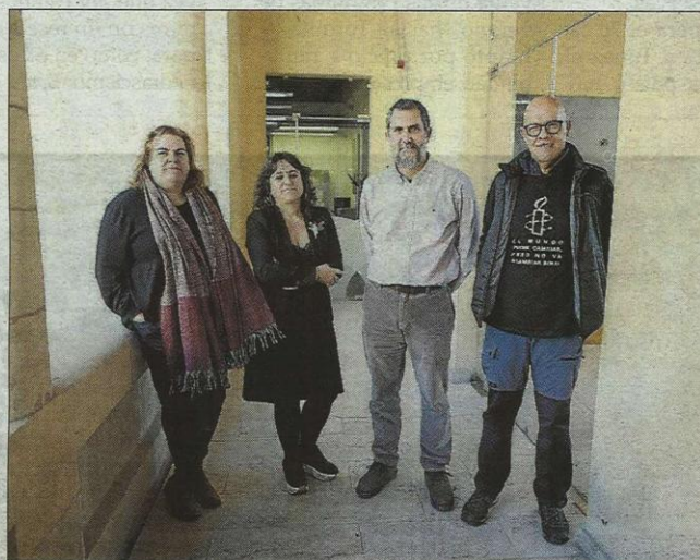
Los organizadores posan tras presentar el proyecto.

La convocatoria comenzará a las 12:45 con la lectura del manifiesto humanitario. A la una se encenderán las bengalas de humo y quince minutos más tarde se interpretará Viatge a Itaca , del cantautor Lluís Llach, quien ha dado su consentimiento. Posteriormente, a las 18:00, se volverá a leer el manifiesto y a las 18:15 se encenderán las bengalas de