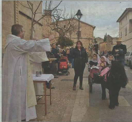
Instante del recorrido hasta la parroquia de Santa Maria. M. BOSCH