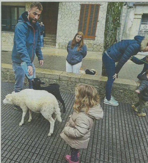
Corderitos en la edad del biberón en Alaró. TONI RUIZ