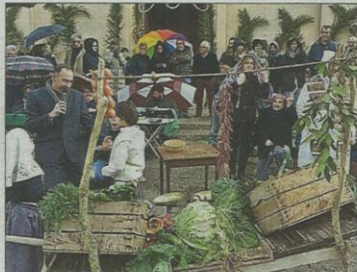
'Beneïdes' de es Carritxó. JAUME RIGO