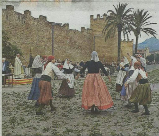
Elevada participación en Alcúdia pese al tiempo inestable. A. A.