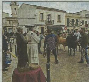
Uno de los 'flashes' de ses Salines.