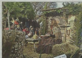
En Son Carrió sobresalió como siempre la esencia rural y el gran cuidado de las carrozas. BIEL CAPÓ