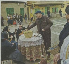
Escena curiosa en s'Horta. J. M.