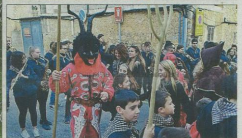
En Son Servera resultó nuevamente llamativa la 'visita de Sant Antoni a Sant Pau i davallada del corb'. También las carrozas y la genuina 'capta' fueron vistas. BIEL CAPÓ