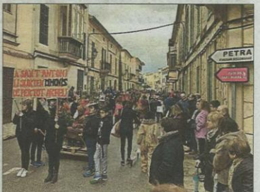
Momento del desfile en Sant Joan. T. O.