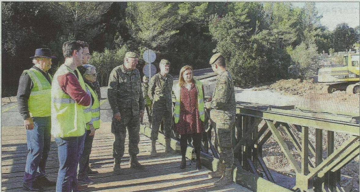
Las autoridades locales e insulares se desplazaron hasta Artà para visitar la nueva infraestructura.

La consellera de Territori destacó que «era una demanda de muchos colectivos afectados a los que se ha querido dar una respuesta. Los habitantes de la Colònia reclamaban soluciones, también todo lo que son las conexiones con el Norte se habían visto perjudicadas. Con esta instalación se ha dado una mayor facilidad a nivel de conectividad». Las autoridades destacaron la gran colaboración que ha habido para montar este puente. «Se trata de un buen ejemplo de la colaboración entre el ejército y el Consell que ha dado una respuesta inmediata a las inundaciones», concluyó Garrido.