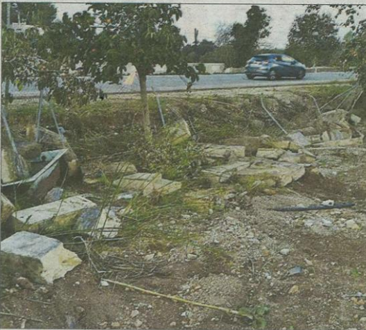
Múltiples caminos, puentes y vías padecieron diferentes daños. A. A.