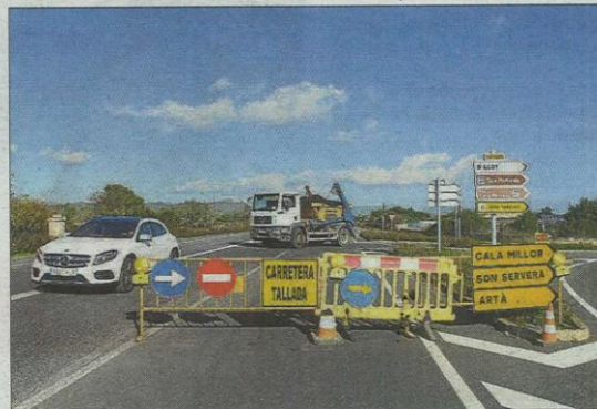
La carretera está cortada a la altura de s'Illot y hay que hacer el desvío.

► El Consell ha tenido que intervenir en 21 carreteras afectadas por las inundaciones. El puente de Artà fue el más dañado y el resto son obras de refuerzo, de limpieza, señalizaciones nuevas, alumbrado y la adecuación de las vías. La inversión es de 23,8 millones de euros.