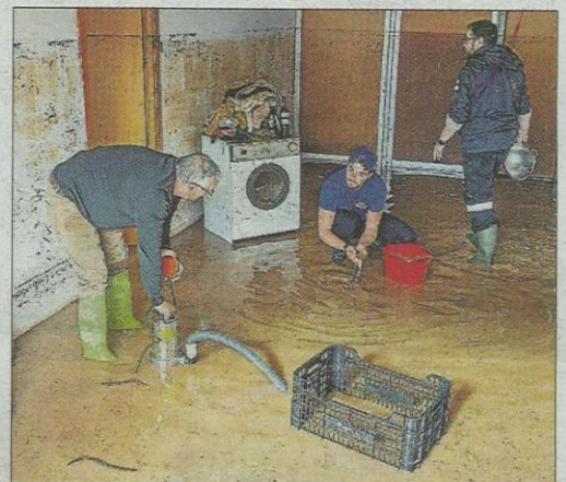
Arriba, el torrente d'en Mesquida. A la derecha, vecinos achican agua de un bajo en Figueras.