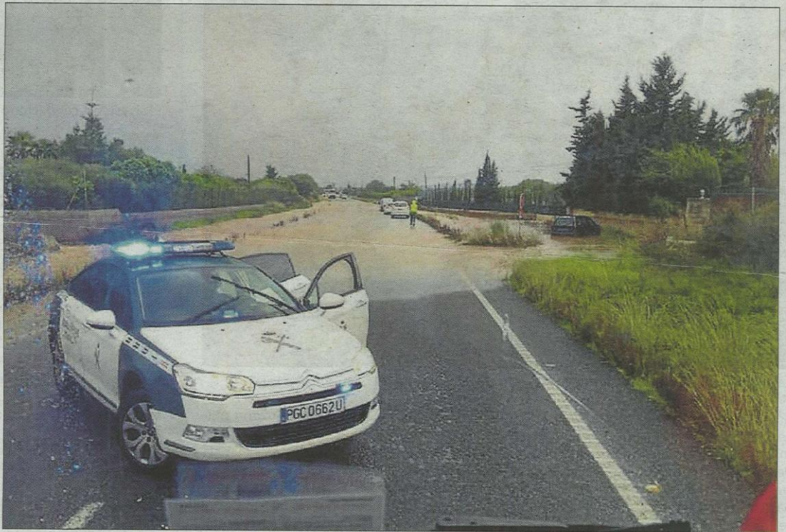
La Guardia Civil de Tráfico, ayer, en una carretera de Capdepera afectada por las lluvias.

Precisamente, el desbordamiento del río Manol llevó a los bomberos de la Generalitat a evacuar ayer por la tarde a una veintena de vecinos de Figueras, después