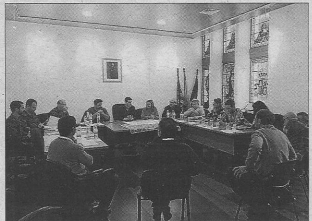
Las autoridades se reunieron en el Ajuntament d'Artà.

nes han decidido tirar adelante este proyecto una vez que se ha comprobado que la instalación del mismo no impedirá que continúen las obras del nuevo puente.