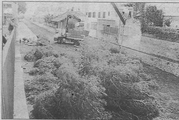
Los pinos están ubicados junto a la estación.

pecies que figuren en el informe paisajístico que se está perfilando.