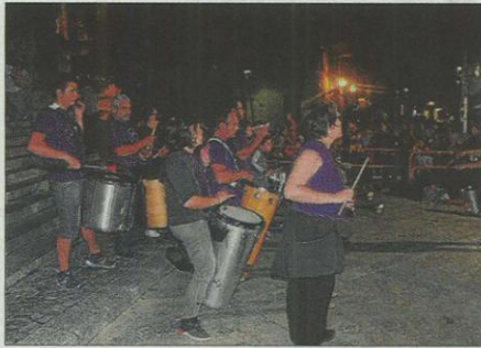
La batucada va posar el contrapunt de percussió.