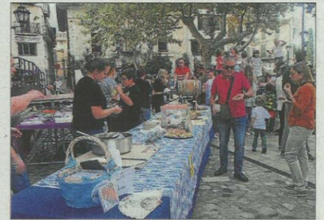
Venda de diferents productes gastronòmics a Plaça.