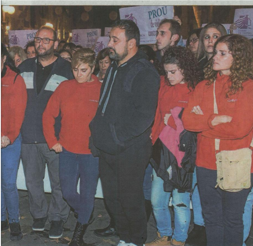
to Roca, el 16 de noviembre, desconsolados durante la concentración de repulsa. JORDI AVELLÀ

violencias machistas: desarrollando los derechos de las mujeres, se centrarán en el ámbito judicial y abordarán temas tales como los estereotipos machistas en los juzgados de violencia de género, la perspectiva de género en la judicatura o el enfoque de género en la actuación letrada.