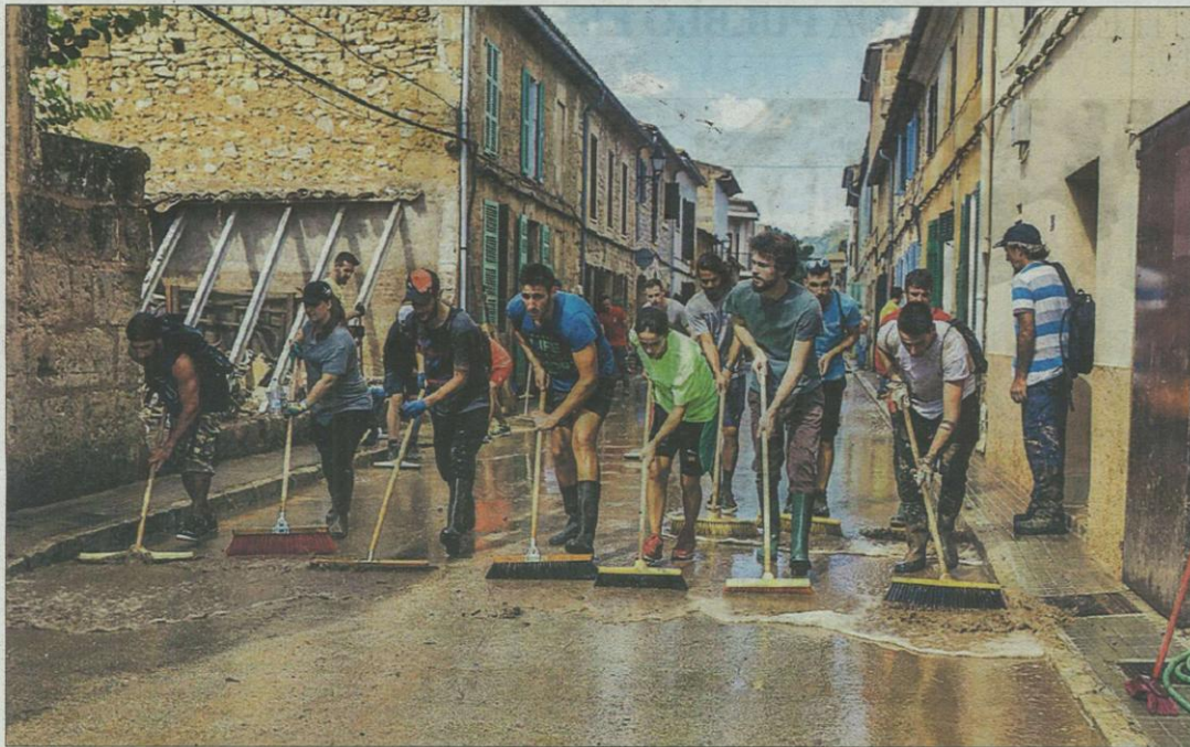
Un grupo de voluntarios ayuda a limpiar una calle de Sant Llorenç después de la riada.