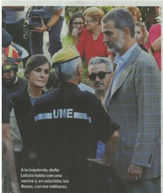
A la izquierda, doña Letizia habla con una vecina y, en esta foto, los Reyes, con los militares.