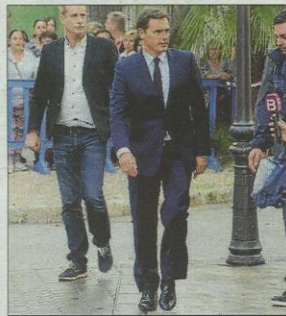
El líder de Ciudadanos, Albert Rivera.