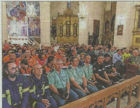
Entidades y fuerzas de seguridad que han ayudado tras la tragedia.

En la parroquia se colocaron en la nave de la derecha los representantes de Guardia Civil, militares, bomberos, Protección