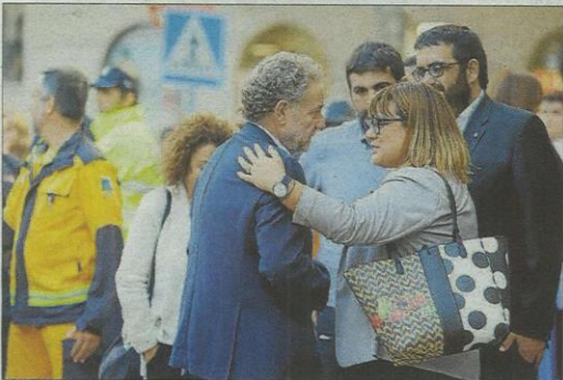
Dolor y solidaridad. En la imagen superior, Biel Company y la portavoz del PP en el Congreso, Dolors Montserrat, a su llegada al templo. Abajo, la vicepresidenta Bel Busquets consuela al alcalde de Sant Llorenç, Mateu Puiggròs.