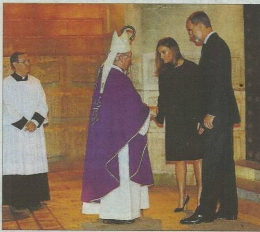
La llegada. El obispo de Mallorca, Sebastià Taltavull, recibió a los reyes don Felipe y doña Letizia en el portal mayor de la parroquia dels Dolors ante la mirada atenta de muchos ciudadanos.

► La parroquia dels Dolors de Manacor acoge el multitudinario y sentido funeral por las 13 víctimas mortales de las inundaciones