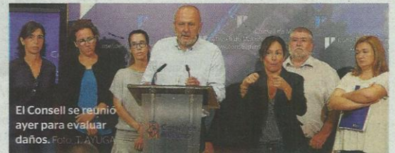
El Consell se reunió ayer para evaluar daños.

La alternativa para circular entre la Colònia de Sant Pere y Artà es utilizar un camino de servicio que es de