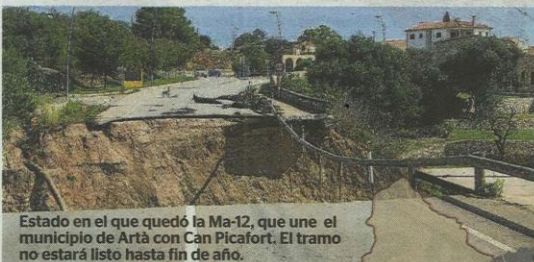
Estado en el que quedó la Ma-12, que une el municipio de Artà con Can Picafort. El tramo no estará listo hasta fin de año.

Otras carreteras dañadas que permanecen cerradas al tráfico son la Ma-15F, la Ma-4023, la Ma-4041 y la Ma-4042. Estas carreteras permanecerán cortadas entre