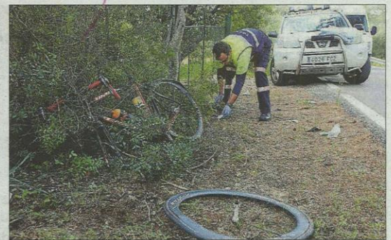
El incremento de los accidentes de ciclistas en los últimos quince años ha hecho que el Consell se movilice para adecuar la red viaria y de bicicletas.

Mallorca parte del objetivo de mejorar la calidad de tránsito a las bicicletas.