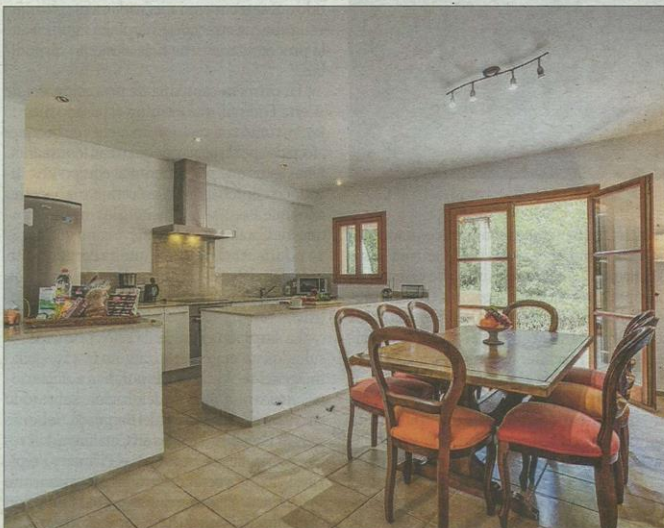
Dispone de una cocina de diseño con barra americana.