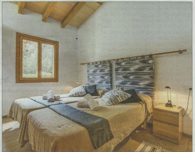
Segundo dormitorio decorado con textil propio de la isla.