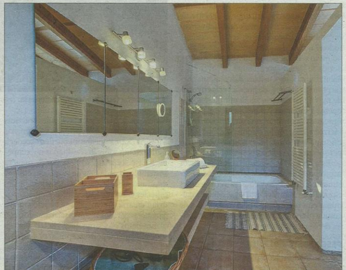
Espacioso baño que cuenta con una bañera y una mampara de cristal.