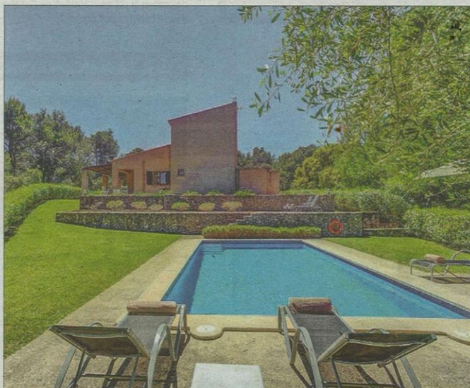
Espectacular zona exterior con piscina.

Esta propiedad se distribuye en dos plantas y se accede a ella a través de un camino rural privado. La puerta principal conecta con la sala de estar/cocina. Gracias a sus grandes ventanales que ocupan desde el suelo hasta el techo, la vivienda cuenta con una gran iluminación natural. El salón, de grandes dimensiones y muy amplio, cuenta con cómodos sofás para relajarse. La cocina, que se encuentra en el mismo espacio, cuenta con todos los equipamientos y destaca una bonita isla central de granito. La villa cuenta con tres habitaciones y dos de ellas se encuentran en la planta baja. La habitación principal se encuentra en la planta de arriba y destaca