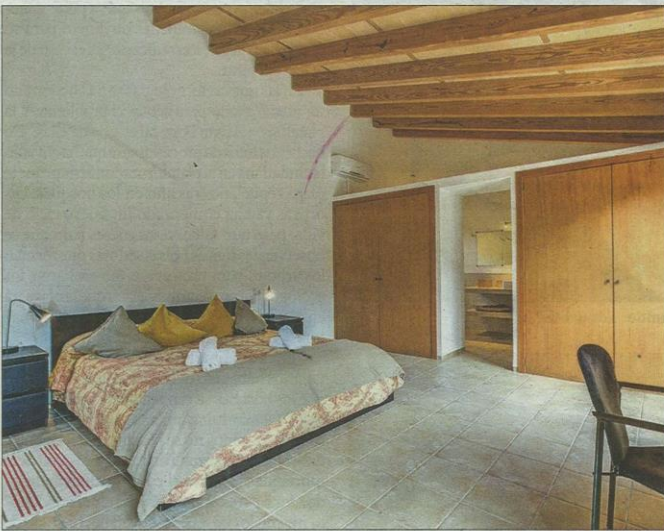
En el dormitorio principal prima la sencillez.