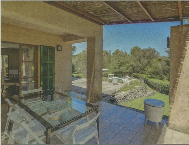
Espacio exterior, ideal para disfrutar entre amigos.