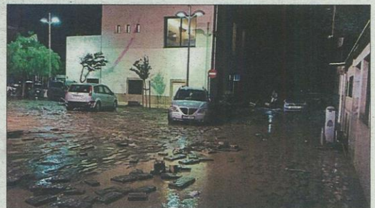
Aspecto que presentaban las calles de Sant Llorenç anoche. T.O.