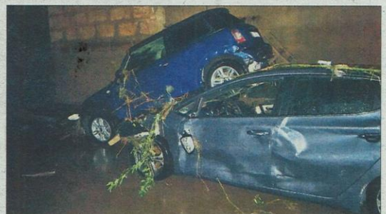
La riada arrastró numerosos vehículos. T.O.

Más de un centenar de efectivos de Salvamento Marítimo, que activaron un helicóptero para sobrevolar el área, Bombers de Mallorca, Guardia Civil, Policial Local y ambulancias se vieron desbordados por la multitud de rescates solicitados, dada la magnitud de la catástrofe.