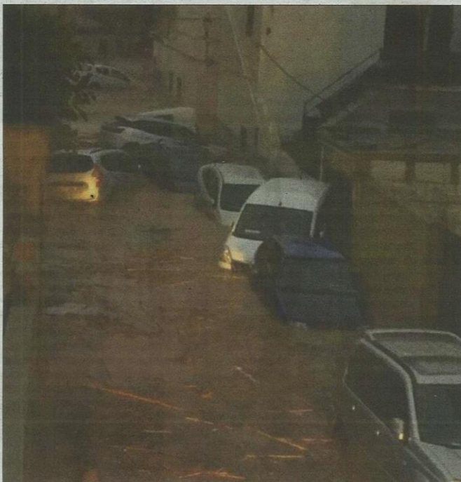
Imagen dantesca que presentaba una de las vías de la localidad.