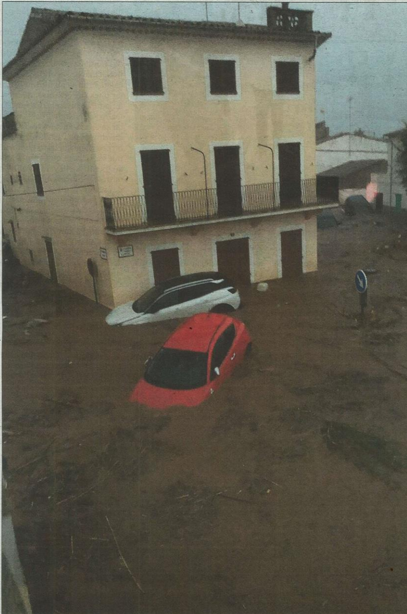
La fuerza del agua tras el desbordamiento del torrente se llevó por delante todo lo que encontró a su paso.

▶ Las fuertes tormentas registradas provocan el desbordamiento del torrente y dejan al menos dos muertos y varios desaparecidos ▶ El agua arrastra vehículos, los conductores quedan atrapados y el pueblo permanece incomunicado