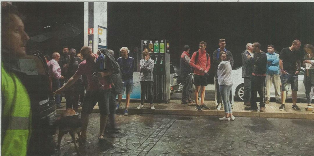
Los vecinos se agolparon en la gasolinera situada en la rotonda de entrada de Sant Llorenç. BIEL CAPÓ

Muchos conductores quedaron atrapados en sus coches en las rotondas de acceso a la localidad desde Son Servera, Cala Rajada y Manacor. Además, varios núcleos urbanos de la zona se quedaron sin suministro eléctrico ni conexiones telefónicas. Cuatro transformadores de la luz cayeron como consecuencia de las fuertes lluvias y dejaron sin suministro eléctrico a buena parte de la población afectada.