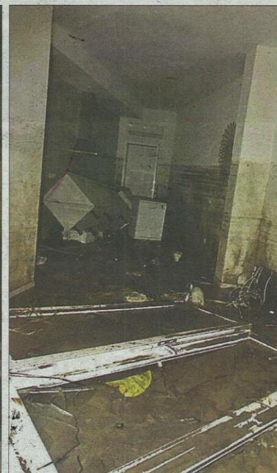
Muchos sótanos quedaron inundados. T.O.