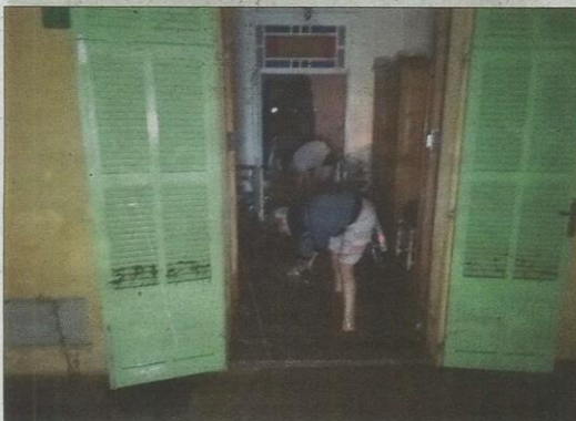
Vecinos de Sant Llorenç achicaron el agua hasta altas horas de la noche. BIEL CAPÓ