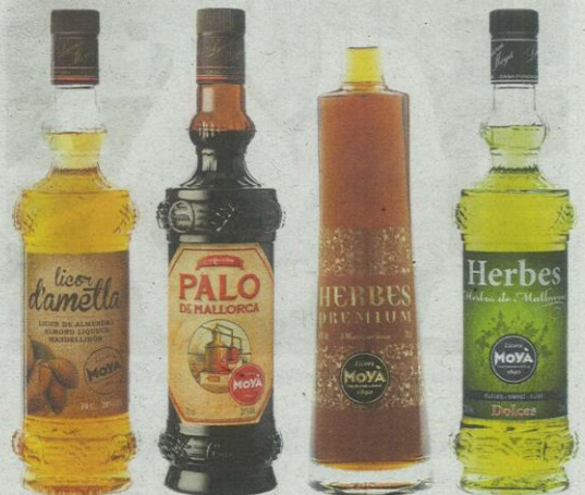
La Fira és un bon moment per tastar els diferents Licors Moyà. LICORS MOYÀ