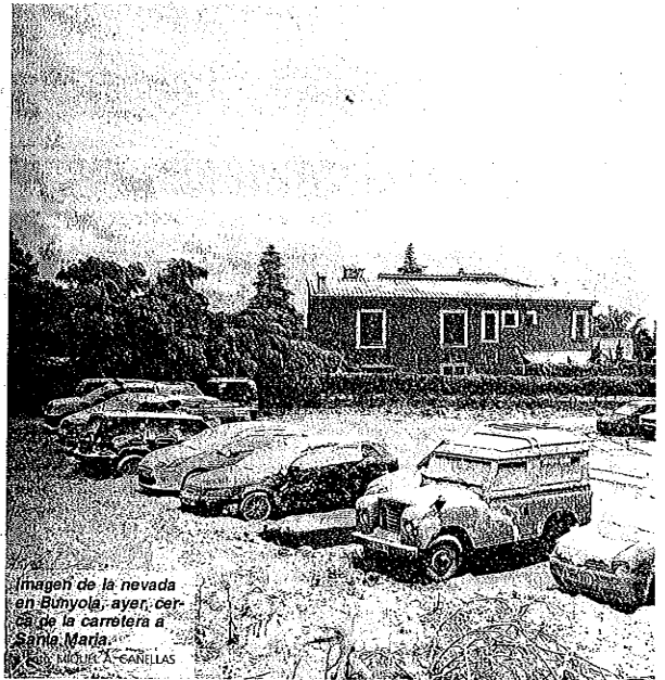
Imagen de la nevada en Bunyola; ayer, cierre de la carretera a Santa María.

La jornada de ayer fue muy fría; las temperaturas máximas oscilaron entre los 4º-7º y las mí-