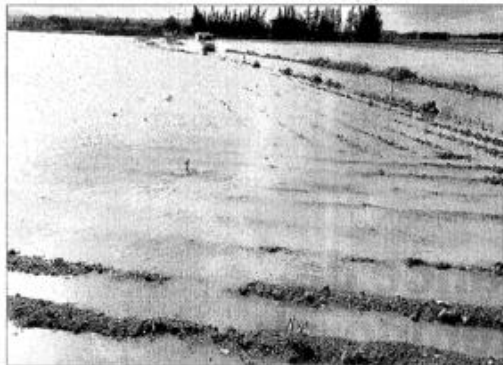
▲ Inundados. Los municipios del Pla de Mallorca han sido los más afectados, así como los campos de sa Pobla y Muro. Solo en Muro se han registrado hasta 116,6 litros por metro cuadrado. ■ Foto: A. SEPULVEDA