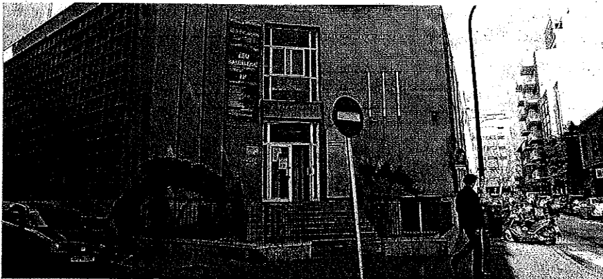
Façana de l'IES Politécnic, on s'invertiran 180.000 euros per perfeccionar l'accessibilitat el 2018. TÈRESA AYUGA

Morante creu que des del Govern s'està fent una "actuació prou important", encara que "s'ha de continuar treballant". En aquest sentit, apunta que l'objectiu que es marxa Educació és eliminar totes les barreres aquesta legislatura. De moment, hi ha la previsió que nou centres no puguin ser realment accessibles fins al 2019. Quatre, fins al 2018. Per a enguany, la previsió és fer obres a 13. Cal recordar que l'accessibilitat abasta més ítems a part de la supressió de les barreres arquitectòniques. El fet que alumnes amb altres discapacitats puguin accedir a l'educació com tothom de manera inclusiva també és una reivindicació reiterada.